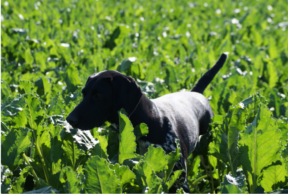
Charly III von Neuarenberg