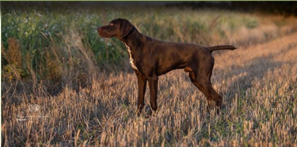
Charly III von Neuarenberg