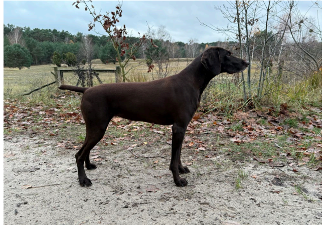
Gina v. Niersbogen

ZB 0316/20 2x Derby 1. Preis (3x4h Nase, Suchen, Vorstehen), AZP 1.Preis (4h stöbern mit Ente) VGP 1. Preis 326P ÜN-Fährte, Btr, HN, Formwert JK SG3, AK V, wunderschöne, elegante Hündin mit dunklem Pigment, zeigt wunderschöne Vorstehbilder, ausdauernd im Wasser mit großer Bringfreude, absolut kompromisslos an Raubwild und Schwarzwild, führerbezogen mit großer Arbeitsfreude, absolut umgänglich mit anderen Hunden und ein super Familienhund, Haus und Zwinger gewohnt.