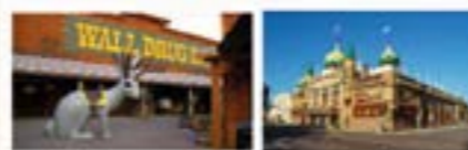
Wall Drug, Wall SD Corn Palace, Mitchell SD

The state of South Dakota is as diverse as its hunting opportunities. From the Prairie to the Black Hills, there is something for everyone!