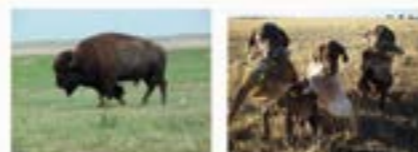
Buffalo A good day's hunt!

Pheasants, Grouse, Prairie Dogs, jackrabbits, Mule deer, White tail deer, mountain goats, bobcats, mountain lions, antelope and of course the ring neck pheasant among many other species! The list is as large as the varied and breathtaking scenery!