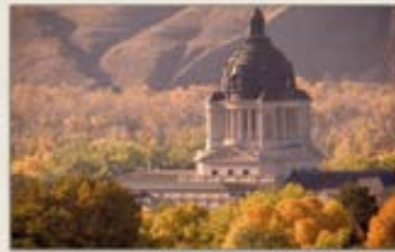
State Capitol Building Pierre, SD

The Cultural Heritage Center opened in 1989 to preserve and interpret the heritage and culture of South Dakota's people. Nestled into a bluff north of the capitol, the Center is the headquarters of the South Dakota State Historical Society. The Center features the State Archives and Museum and houses the Society's administrative, historic preservation, and research and publishing offices.