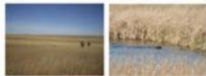
S. Dakota offers the perfect habitat to showcase the DKP. Plentiful game and great testing and hunting

The testing rules and procedures for the NAKP can be found at www.https://dk-verband.de . (04. Regulations IKP). For more information on how to enter, please send an e mail to: derkurzhaar@live.com