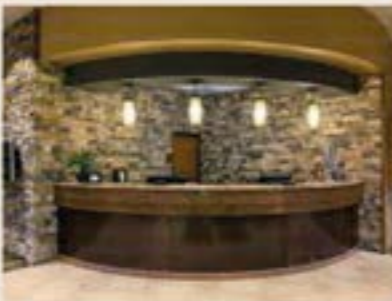
The 2025 NAKP Venue Ramkota Motel and Convention Center Pierre, SD https://ramkotapierre.com/